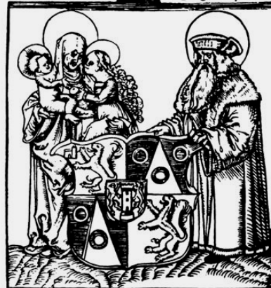
titulní list šlikovského rozšířeného horního řádu z roku 1525