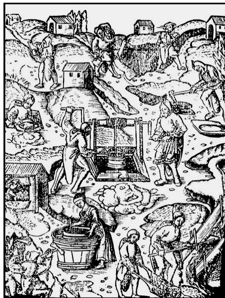
dřevorytina jáchymovských hornických činností z knihy Hanse Rudhardta

Habsburkové se od samého počátku nástupu k moci snažili odvrátit úpadek dolování. Osvozovali báňská města od daní a povyšovali je na královská horní města, pokoušeli se zavádět pořádek do horního podnikání, potírali podloudnictví s vytěženým kovem, vypláceli