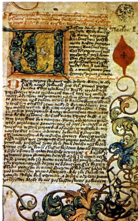
Ius regale montanorum (český překlad ze 16. století)