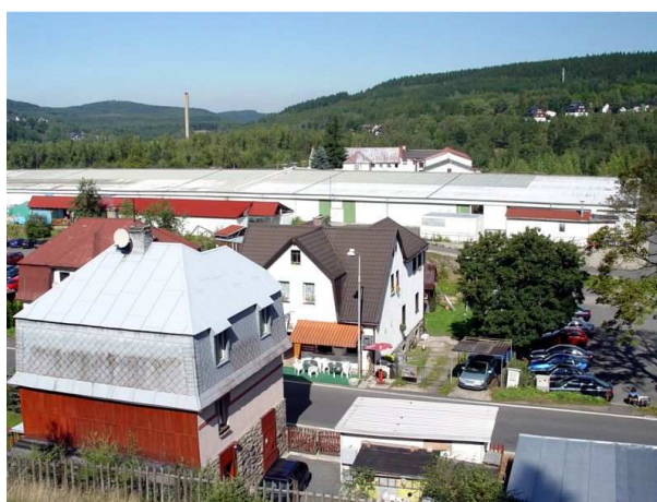
největší budova ve městě poskytla azyl trhovcům (Potůčky, 2006)

Pravý podnikatelský boom, známý z přelomu 19. a 20. století, přes úvodní popřevratovou euforii hory prakticky nezasáhl. Nejlepším hospodářem je soukromá firma, se dennodenně dozvídali nezkušené radní z obrozených médií. To, že by roli soukromníka mohla hrát obec, jim rozum nenašepal. Ani se nepodivili nad tím, proč jim, sakra, stát navrací historický majetek. Mnohá radnice proto vytloukala klín klínem a prodávala o sto šest, co se dalo. Za babku se nakupovaly nemovitosti, ale většinou pouze za účelem spekulace. Kdo v dětství miloval pohádky se zákonitě upamatoval, jak hloupý a líný český Honza udělal díru do světa. Nazrála doba pro Český Sen – jak bez zdlouhavého lopotění fofrem zbohatnout. Svět konečně pochopil pravý význam slova tunelovat.