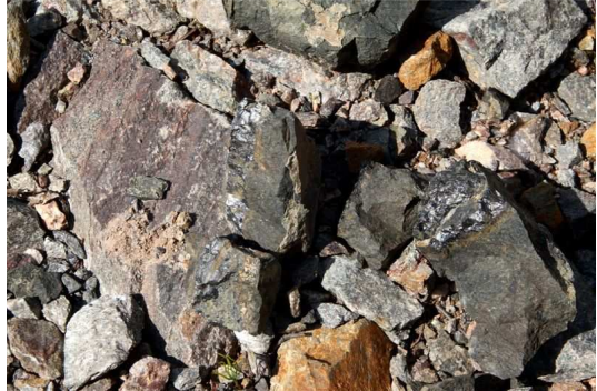
i dnes se na rozvážených jáchymovských odvalech nalezne uranová ruda – černý lesklý smolnec

5) Období těžby uranové rudy k výrobě štěpných materiálů (1945-1962) (uranová ruda se v letech 1945-1947 uplatnila jak při spuštění prvního sovětského zkušebního reaktoru v prosinci 1946, tak pomohla překlenout i kritické období projektu výroby sovětských atomových zbraní)