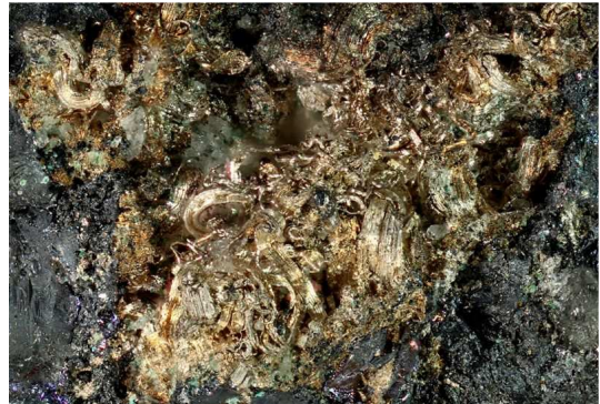
drátkovité stříbro a šedý argentit jsou nejbohatší stříbrné rudy (halda Dolu Schweizer, 2003)

1) Období těžby stříbrných rud (1516-1600) (již ve 40. letech však dochází ke zlomu a intenzita dobývání začíná upadat podobnou rychlostí, jakou zpočátku rostla)