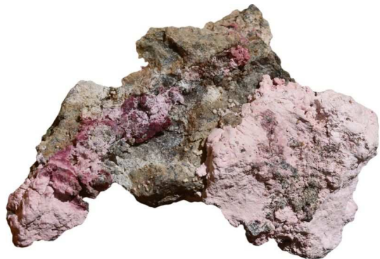
typický produkt oxidace primárních kobaltových rud – fialový až růžový erythrin (štolá č. 1 – Vysoká Jedle, 2000)

2) Období těžby rud barevných kovů, zejména k výrobě kobaltových barev a vizmutu, s příležitostnou těžbou stříbrných rud (1600-1850) (kobalt z Jáchymova sice nebyl bezvýznamný, ale nikdy neměl rozhodující úlohu při výrobě barev, tzv. smaltu, který byl prakticky monopolem saských hutí)