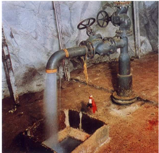
pramen Běhounek po slavnostním křtu v roce 1962

6) Období těžby radioaktivní vody, které trvá od ukončení těžební činnosti n. p. Jáchymovské doly v Jáchymově v roce 1962 dosud (přesto dnes o Jáchymovu již nelze hovořit jako o městě hornickém, nýbrž jako o městě lázeňském)