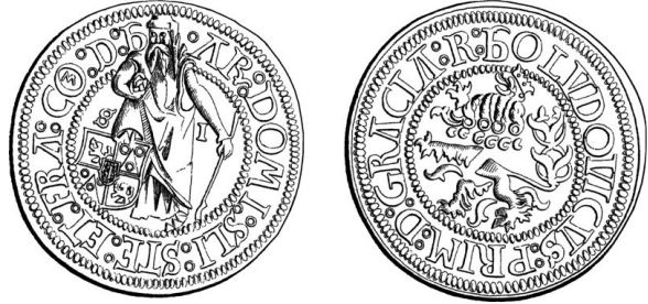
vůbec první jáchymovský tolar

- Poprvé počátkem 16. století díky ražbě nové velké stříbrné mince – tolaru, která měla ve směnném styku nahradit nepostačující množství mincí zlatých. Tolary se rozšířily po celé Evropě, později i do jiných částí světa, v různých obměnách a pod různými názvy.