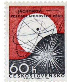
poštovní známka z roku 1966 (v hlubinách zářící uranová ruda a schematický model atomu)

- Podruhé na přelomu 19. a 20. století, kdy manželé Curieovi izolovali z jáchymovského smolince dva nové prvky – polonium a radium. Jáchymovské doly se rázem staly nejdůležitějším báňským podnikem světa. Jáchymov „porodil“ lázně využívající radioaktivitu.