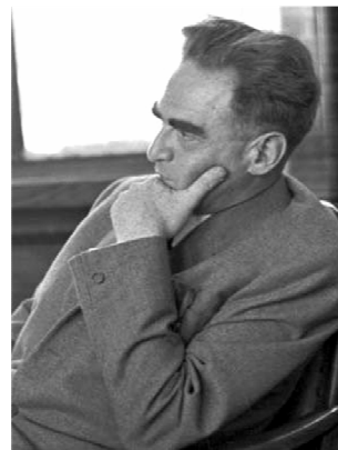
svého času druhý nejvýše postavený komunist Rudolf Slánský (a stejně mu soukmenovci „vykrotili“ krk)