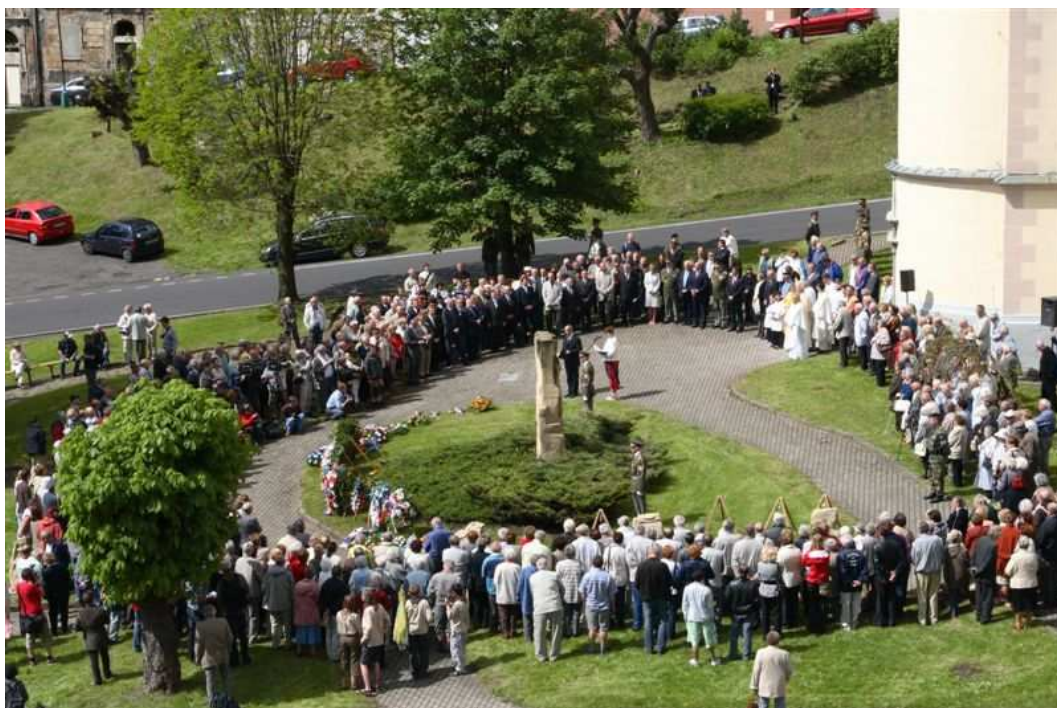
„Jáchymovské peklo“ (každoroční setkání politických vězňů v Jáchymově)