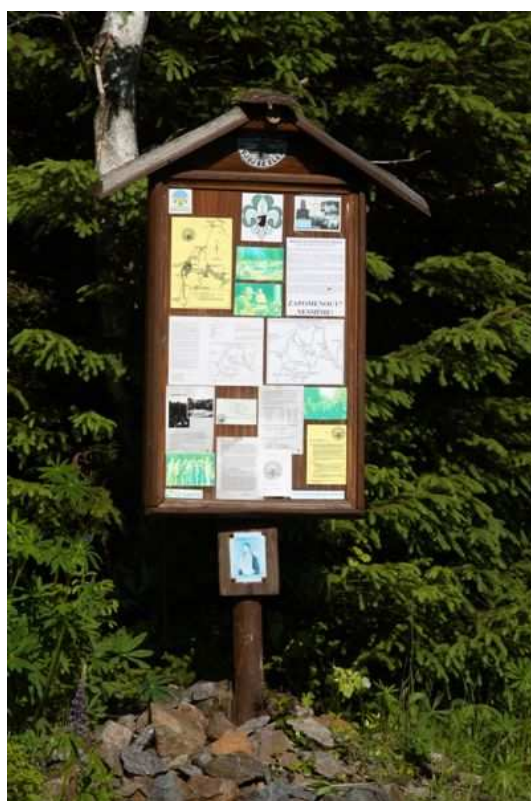
skautská mohyla poblíž někdejšího lágru Eliáš